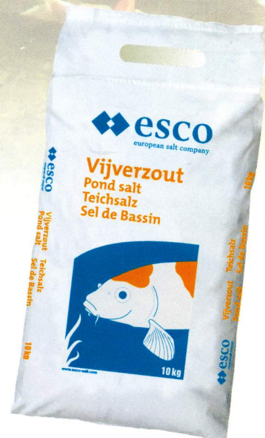
So sieht er aus, der neue 10 kg Sack esco Teichsalz

esco Teichsalz für Endverbraucher ist im praktischen 10 kg Kunststoffsack erhältlich.